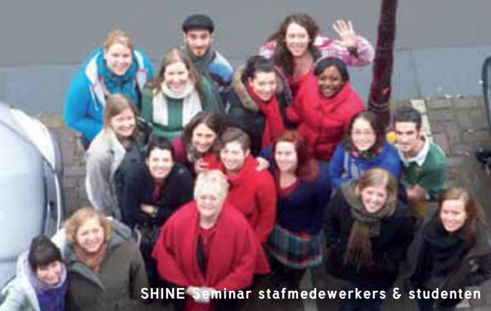
SHINE Seminar stafmedewerkers & studenten