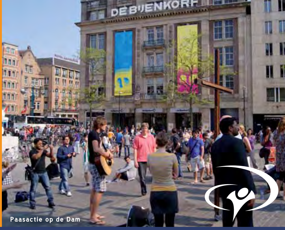
Paasactie op de Dam